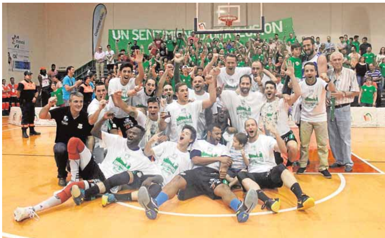
El CB Morón celebrando antes de verano el ascenso a LEB Plata en el Pabellón Alameda

una prueba deportiva. En este caso, se trata de la sexta edición de la Milla Urbana Morisca, una carrera que se realiza en los alrededores del recinto ferial y que, con cada nueva edición, va ganando adeptos. Comenzará a las 20:30 horas de la noche.