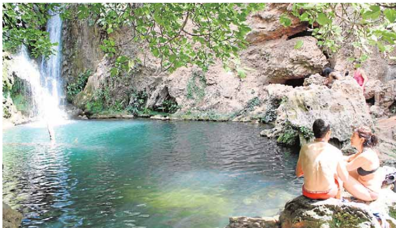
Algunas personas disfrutaban del baño en la cascada en la que un joven perdió la vida el pasado 22 de agosto

las 12 horas con el rezo del ángelus y la salve. La función principal tendrá lugar a las 19.30 horas y posteriormente saldrá en procesión por las calles del municipio acompañada por la Banda de Música de Nuestra Señora de Guaditoca. A.C.