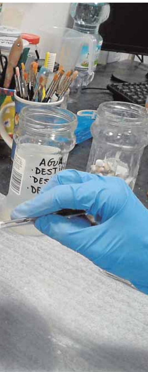
...entes en esta pieza de la Edad del Cobre. B.M.

con objetivo de continuidad y que enfrentará en esta primera edición a los mejores futbolistas veteranos de cuatro de los pueblos de la Sierra Sur. En esta competición participarán los equipos de Écija, Aguadulce, Mariñaleda y el equipo local. B.M