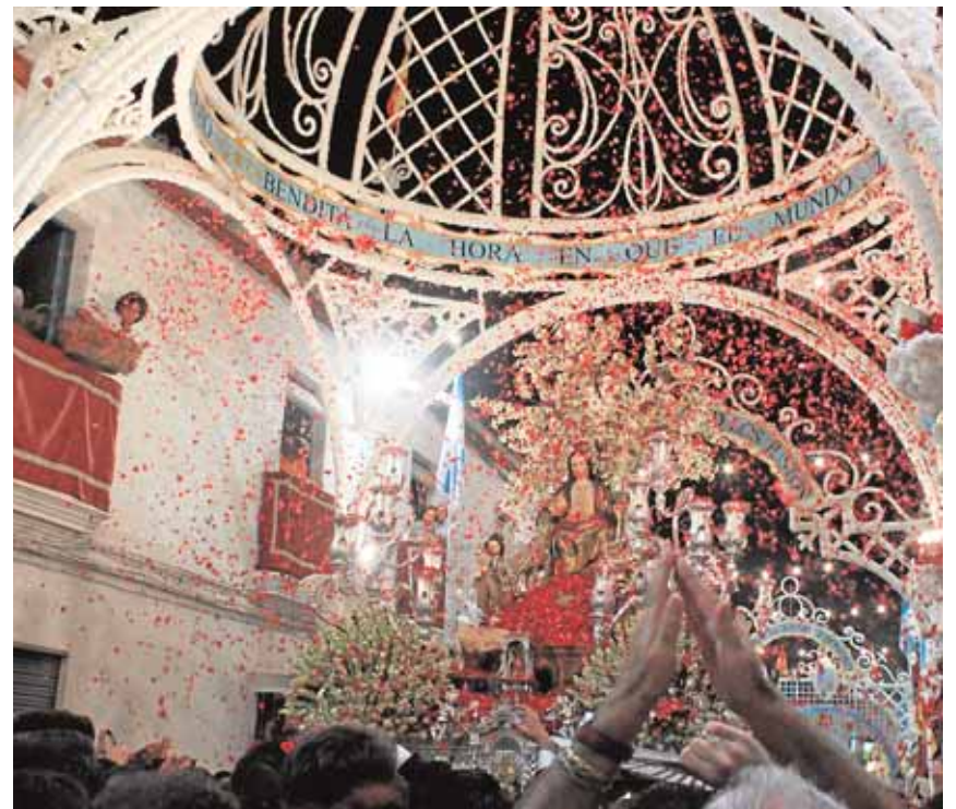
La Divina Pastora procesiona entre muestras de fervor en Cantillana J.C.R.

A las diez de la noche el paso de la Divina Pastora de Almas, iluminado por luz eléctrica en sus candelabros desde 1919, inicia la procesión portado por los hermanos costaleros. La fragancia de los