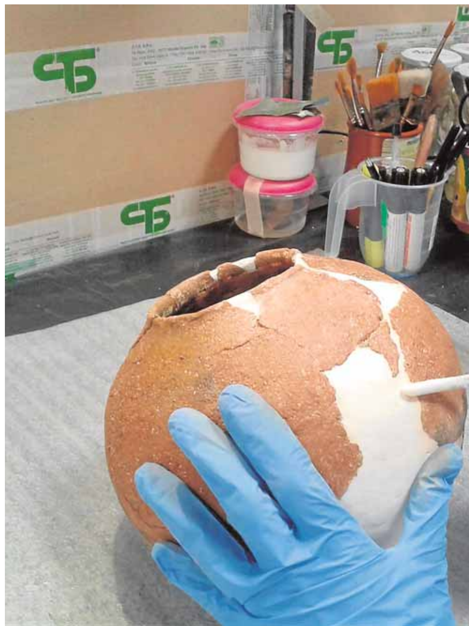
Verónica Álvarez en una intervención activa, con la que completa las lagunas exist

Siguiendo todos los criterios de restauración y conservación exigidos hoy día durante el proceso, resulta casi increíble el buen estado de conservación en el que se encuentran las piezas, que bajo el amparo de la Colección Museográfica recibirán las pautas correctas preventivas para asegurar su estabilidad física y química. De esta forma piezas de hace 4.500 años volverán a hablar a los espectadores de su uso. «Es importante conocer nuestro pasado para comprender mejor nuestro