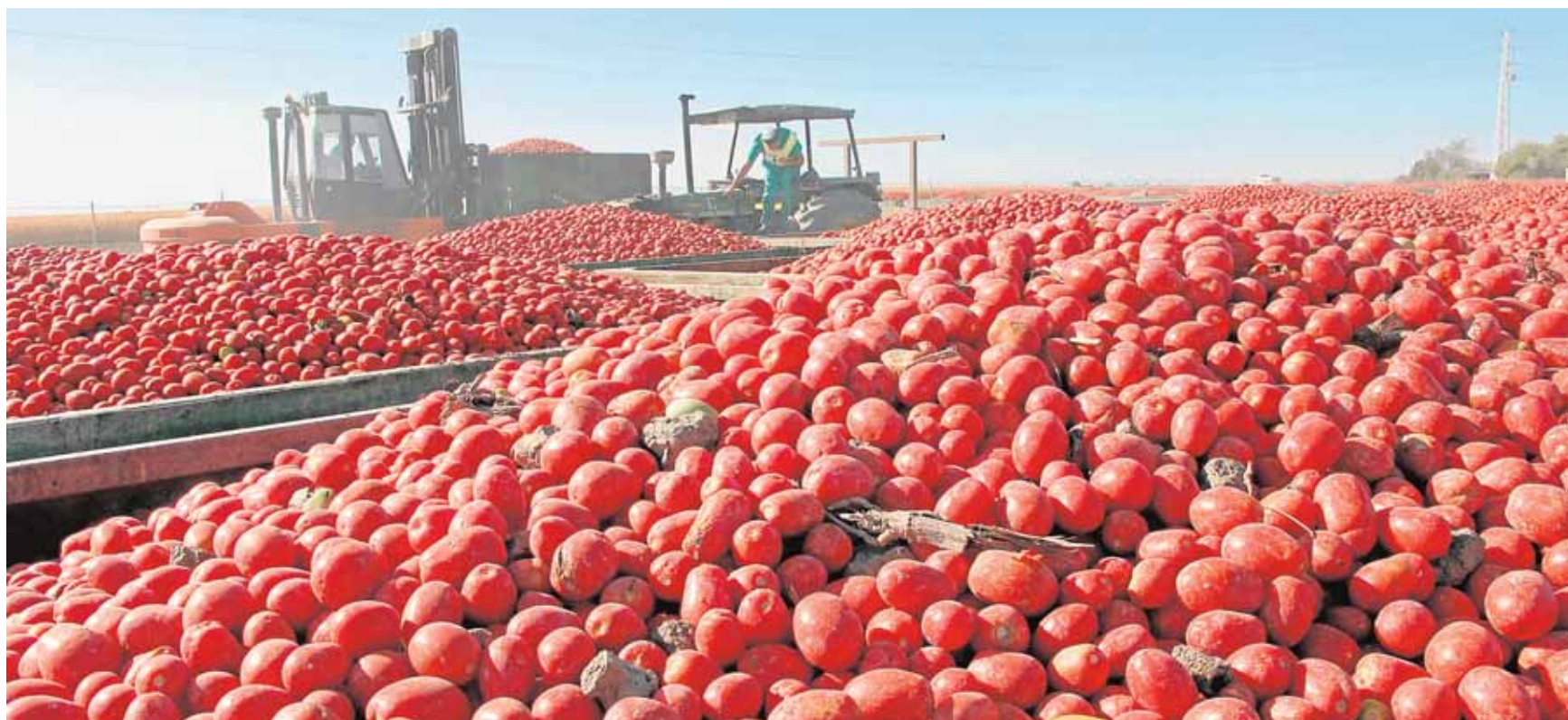
Un mar rojo de tomate industrial ha inundado un año más en los meses de julio y agosto las marismas y las instalaciones de la cooperativa